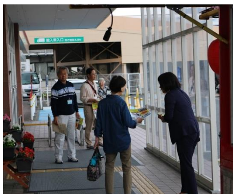
アル・プラザ 野洲店