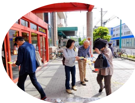
アル・プラザ 瀬田